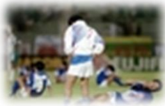
・ピッチにいました